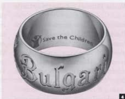
SCHÖNE AUSSICHTEN 1 Mobiltelefon aus der Vertu-Ferrari-Kollektion. 2 Die exklusiven Düfte von Bond im neuen Concept-Store Apropos Düsseldorf. 3 Prickelnder Luxus: Dom Pérignon Rosé Vintage und Glas by Sylvie Fleury. 4 Bulgari-Charity-Ring in Sterlingsilber, 290 €. 5 Hingucker: die Treppe im Max-Mara-Shop.

SHOPPINGNEWS UND AKTIONEN: HIGHLIGHTS AUS DEM VOGUE-KOSMOS